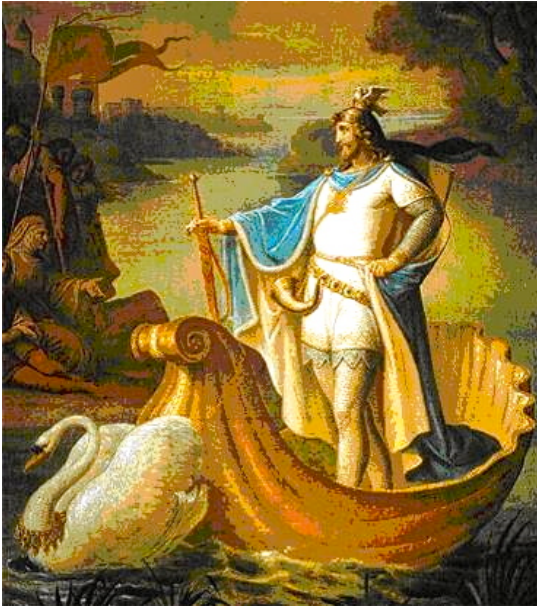
August von Heckel, L'arrivo di Lohengrin nel Brabante (particolare del dipinto murale nel Salone), Castello di Neuschwanstein, 1882-83.