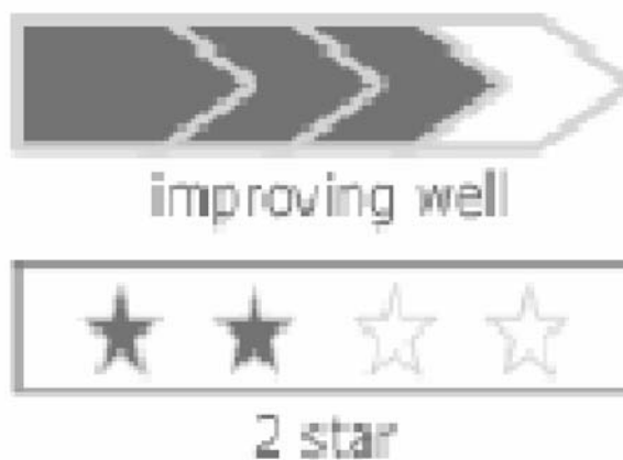
Tavola 2 Lo scoring delle performance degli enti locali: il significato delle stelle

Scoring: 4 = well above minimum requirements - performing strongly 3 = consistently above minimum requirements - performing well 2 = at only minimum requirements - adequate performance 1 = below minimum requirements - inadequate performance